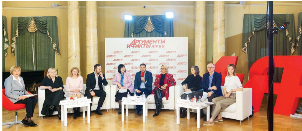
Пресс-конференция АКАР «Рекламные доходы в издательском бизнесе. Итоги 2023 года». Москва. 4 апреля 2024 г.

Как отмечается в релизе АКАР, 2023 год, несмотря на все проблемы, с которыми сталкивается индустрия сегодня, оказался самым успешным за последние полтора десятка лет для отечественного рекламного рынка. Суммарный объем рекламы во всех основных сегментах ее распространения – видео, аудио, издательский бизнес, Out of Home и интернет-сервисы – в 2023 году составил почти 731 млрд рублей, что на 30% больше, чем годом ранее. С учетом всех бюджетов, инвестированных в продвижение товаров и услуг, включая рекламные бюджеты на разработку и создание креативов, производство рекламной продукции, оплату услуг рекламных агентств и технологических посредников, маркетинговые услуги, продвижение в сфере ритейла (как в офлайн-торговле, так и в маркетплейсах), суммарный объем российского рынка маркетинго-